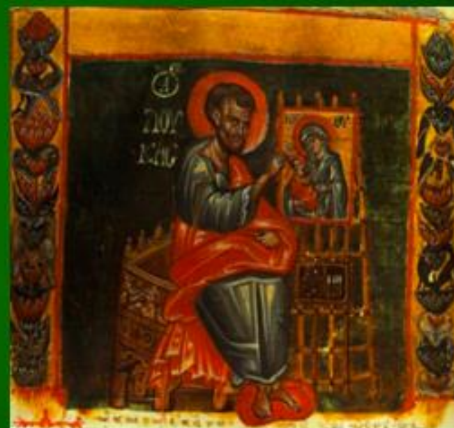
Μικρογραφία χειρογράφου 13ου αιώνα (Μονή Αγίας Αικατερίνης Σινά)

Μεταπτυχιακή Έρευνα στον Τομέα Εκκλησιαστικής Ιστορίας, Χριστιανικής Γραμματείας, Αρχαιολογίας και Τέχνης